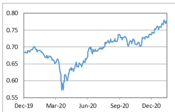
澳元兌美元日綫圖