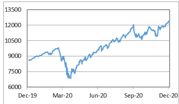
納斯達克綜合指數