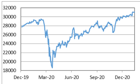
道瓊斯工業平均指數