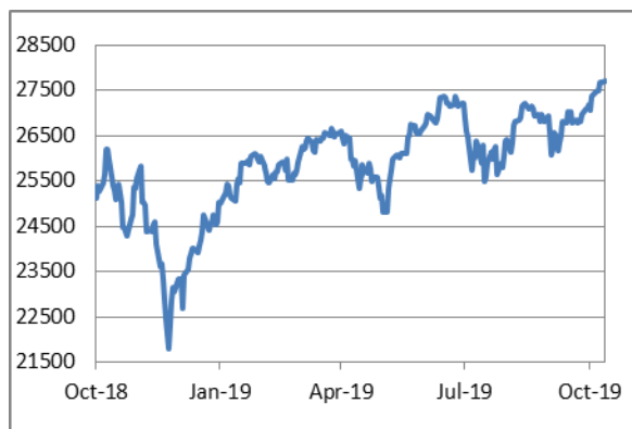
道瓊斯工業平均指數