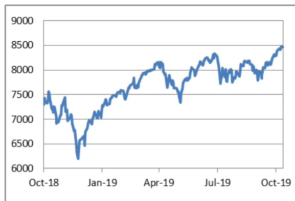
納斯達克綜合指數