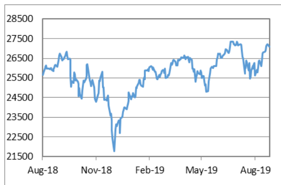
道瓊斯工業平均指數