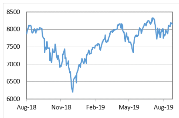
納斯達克綜合指數