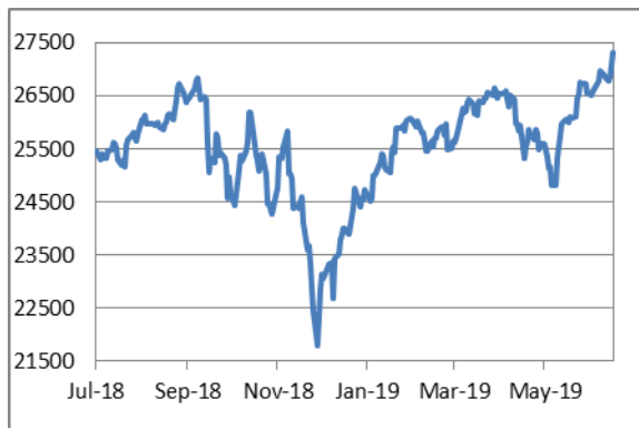
道瓊斯工業平均指數