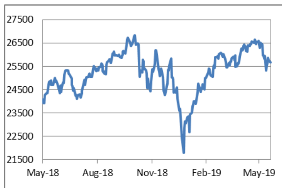
道瓊斯工業平均指數