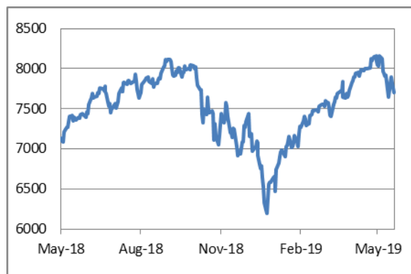
納斯達克綜合指數