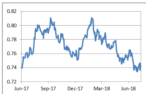
澳元兌美元日綫圖