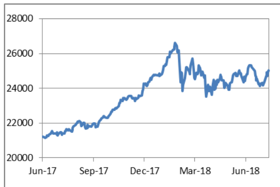
道瓊斯工業平均指數