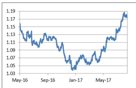
歐元兌美元日綫圖