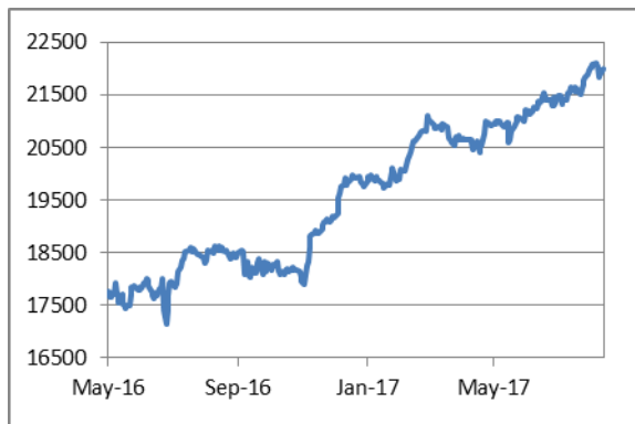
道瓊斯工業平均指數