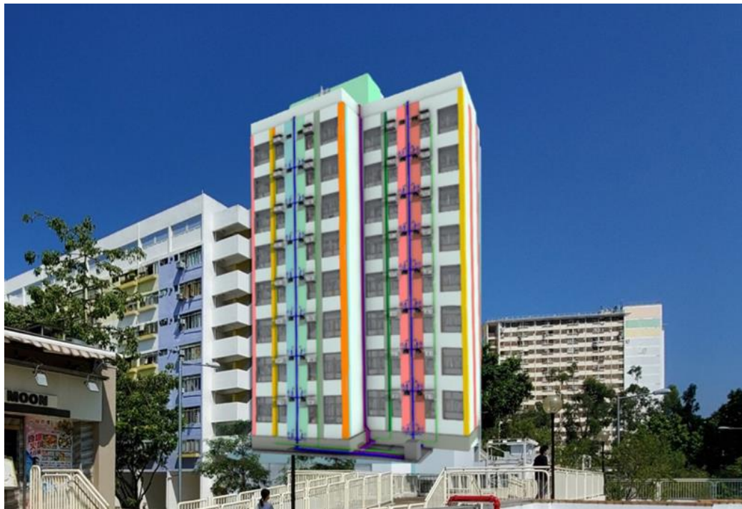
其士國際首筆綠色貸款用於興建房協首個採用 MiC 的長者屋項目——沙田乙明邨「松悅樓」，以構建一個更美好的環境。(此為構想圖)